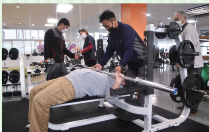
何キ口持てるかな?

※テックス板(ミバエ防除用誘殺板) ミカンコミバエ、ウリミバエなどの害虫対策として、誘引剤と殺虫剤が含まれた板のことで、自然に土に溶け込むような素材で作られています。