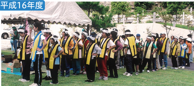
やんばるの集い運動会 ミースイ公園にて開催、余興入場前の様子