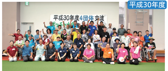
4団体交流ポッチャ大会&バーベキュー みんなの笑顔が素敵です！！