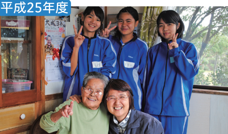
中学生ボランティア お家をピカピカにしてハイ、チーズ！