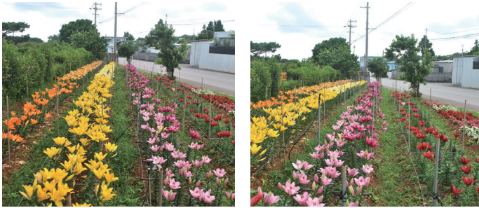
見頃を迎えた花壇の様子(5月9日撮影)

「華の門口はなしゃあたいばる」では、東江上老人クラブの皆さんが丹精を込めて植えたゆりの花が、道行く人の心を癒すように満開に咲き誇っていました。