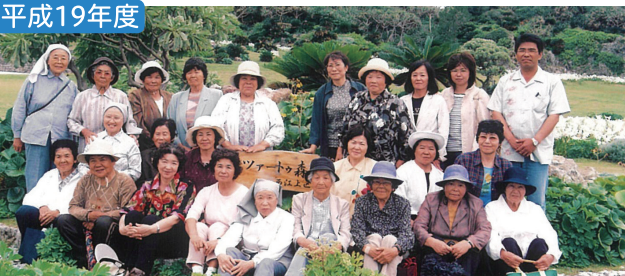
西江上ミニデイ村内ドライブ リリーフィールド公園にて