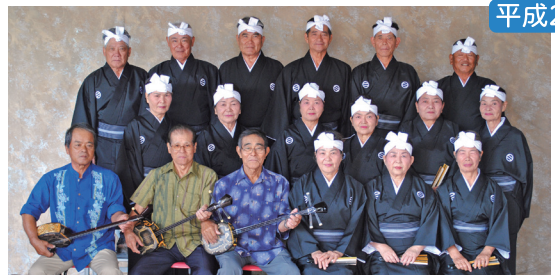
北部地区老人芸能大会 川平老人クラブ出演