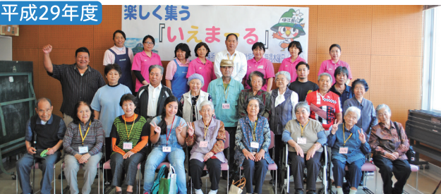
いえまーる事業 和気あいあい！みんなの居場所！