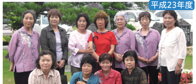
伊江村民生委員児童委員協議会 伊江中表敬訪問