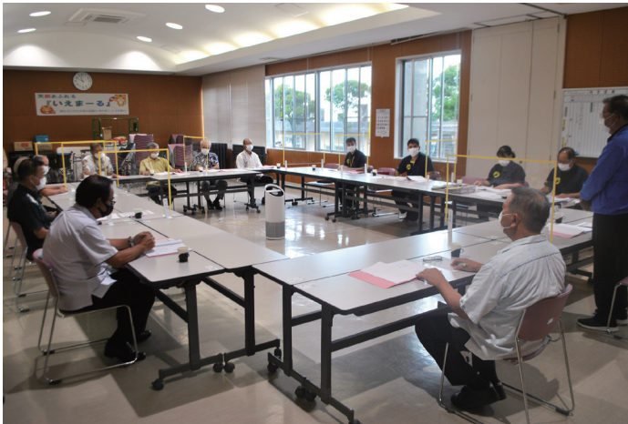
令和4年度 第1回理事会