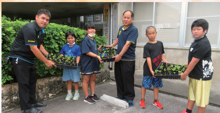
伊江村立西小学校 栽培委員の皆さん