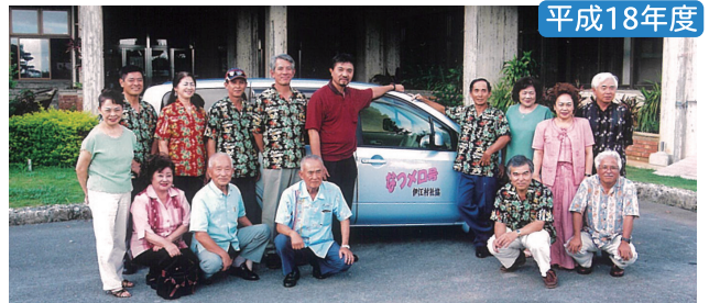
なつメロ出演者の皆様 チャリティー寄附金により車輛購入