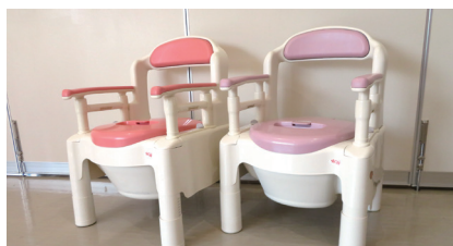
ポータブルトイレ