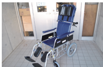
リクライニング式車イス