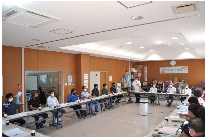
令和4年度 第1回評議員会