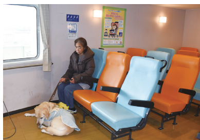
フェリーぐすく(右側最前列)