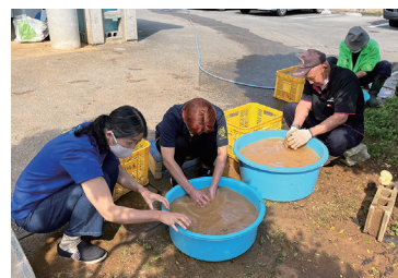
畑で収穫した野菜。無人売店で販売しています!