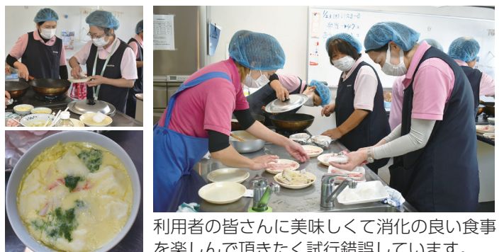
利用者の皆さんに美味しく消化の良い食事を楽しんで頂くたく試行錯誤しています。