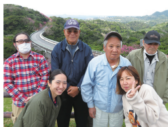
桜見後に記念撮影(^^)/