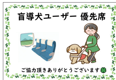
優先席目印カード