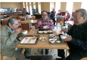
美味しいご飯に自然と笑みも会話も弾みました!(^^)!

1月28日、レク活動の一環として村外視察研修を実施し、ドン・キホーテでのショッピングやホテルでのランチバイキング、八重岳の桜見など一緒に楽しみました。リフレッシュ時間も大切にしながら、各種作業にも取り組んでいきたいと思ひます。