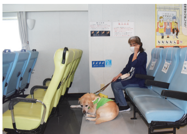
フェリーいえしま(3列目)

伊江村のフェリーには優先席が設けられていて、誰もが安心して座れるよう配慮がなされています。中でも、盲導犬ユーザーが利用しやすい席（足元が広い席）があります。これまでもステッカーが壁に貼られるなど皆さんへの周知もされていましたが、今回社協でも「優先席目印カード」を作成して対象の席へ設置することとなりました。フェリーに乗る際にぜひ一度ご確認頂くとともに、盲導犬ユーザーの方が利用する場面でのご理解・ご協力をお願いいたします！