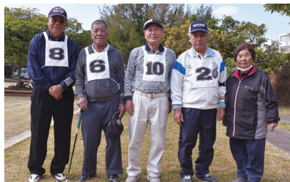
決勝トーナメント進出

村代表として西崎老人クラブと東江上老人クラブが出場しました。西崎チームは決勝戦まで勝ち進み優勢のまま試合を運びましたが、試合終盤に逆転を許し惜しくも敗れ準優勝となりました。