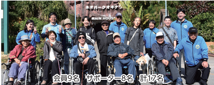
会員9名 サポーター8名 計17名