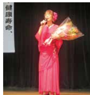
華やかな衣装に身を包み素晴らしい歌唱力で観客を魅了しました