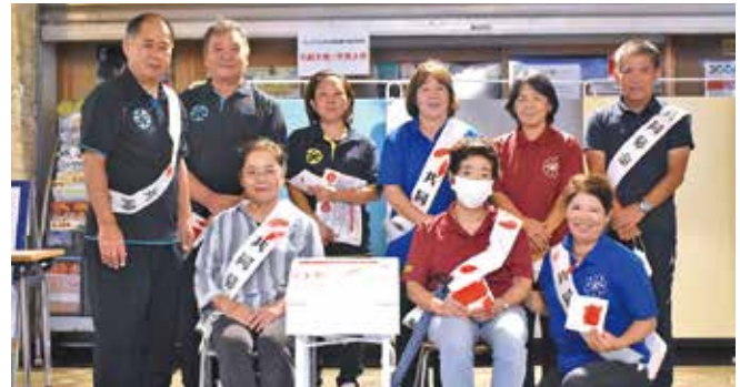
☆福祉事業に関わる皆さんと切符売り場前にて3日間の街頭募金を実施しました☆