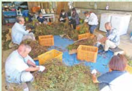
落花生もぎ取り作業

8月には村からの委託事業である落花生のもぎ取り作業を開始し、新しく増えた所員の皆さんと共に取り組んでいます。