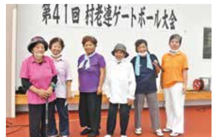
2位の東江前Bチームの皆さん 次回は優勝を目指します