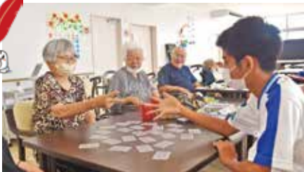
中学生ボランティア