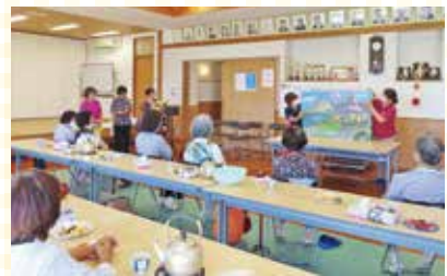
『名医クワタ』/西江前区