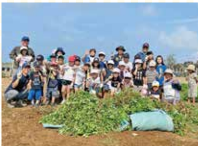
ジーマミ、沢山収穫できました!

8月18日の西江前区ミニデイで、青空学童の子供達とジーマミムイ&交流会を行いました。収穫されたばかりのジーマミをミースイ公園で一緒にもぎ取り、公民館で茹でている間に交流会をしました。