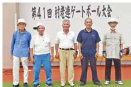
優勝した東江前Aチームの皆さん 優勝おめでとうございます