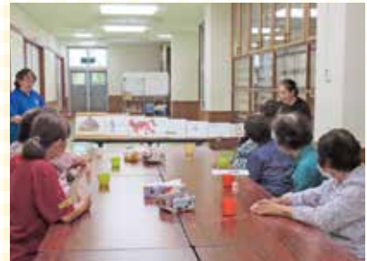
『かやぶき屋根の家』/西江上区

朗読者もスタッフもミニデイ参加者の皆さんから島ふとうばを学びつつ、毎回会話が弾んで楽しい交流ができています。島ふとうばを日常で使うこと・残していくことの大切さを感じました。島ふとうば、ならちとうらしんしより～♪(教えてください～)