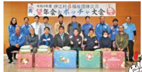
村内福祉団体交流事業