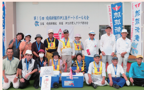
西江上、西崎、東江前チームのみなさん