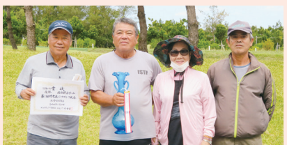
団体優勝：西江前 B チーム