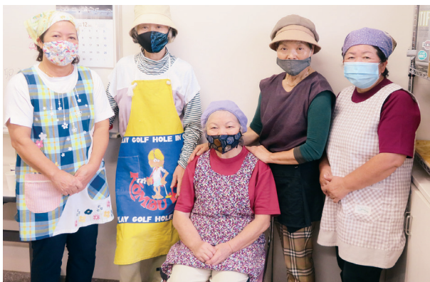
おいしい食事を作ってくれる調理ボランティアのみなさん

「いえまーる」では調理ボランティアの皆さんが作ってくれるおいしい昼食を200円で食べることが出来ます。