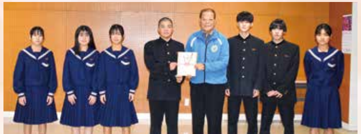
伊江中学校生徒会

10月から1月までの間、赤い羽根共同募金の取り組みとして行われた学校募金(貯金箱募金)の贈呈式がそれぞれ行われました。児童・生徒の皆さんから寄せられた募金は、支援を必要とする世帯へ「紙オムツサービス」や「居場所づくり事業」「フードバンク事業」など様々な形で活用させていただきます。ご協力ありがとうございました!!