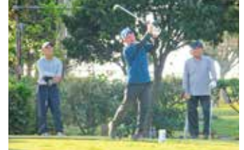
会心の一打!ナイスショット✦