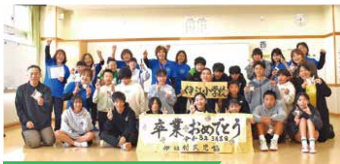
伊江小学校卒業生:3月11日(水)