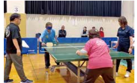
沖縄県代表として九州大会での 活躍にも期待します🔥