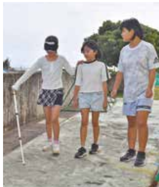
福祉体験学習:3月5日(木)