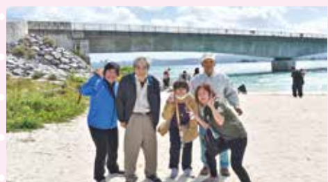
笑って笑って!はいチーズ(^^)v