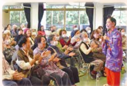
一部・二部を通して絶妙な “ユンタク”で観客も大笑い！