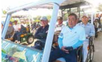
団体優勝した東江上チーム