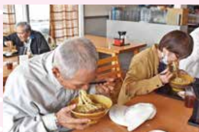
美味しい昼食に夢中☆!!

2月24日に村外レクとして古宇利島観光をメインに行ってきました。羽地モーレの中にある伊佐川食堂で昼食を楽しんだ後にいざ古宇利島へ!古宇利島には久しぶりに来た所員や初めて来たという所員もいて「風景も大分変わったね」「伊江島と違う離島が見れて嬉しい」など色々な声が聞かれました。散歩したりおやつタイムやお土産なども購入したりと思いいいに過ごし、また名護でのショッピングも行い充実した村外レクになりました。リフレッシュ時間も大切にしながら所員の今後の活動にも繋げていきたいです。