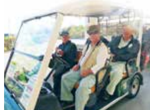
2位の西江前チーム