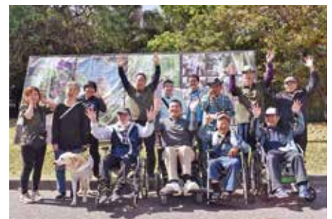
熱帯ドリームセンター到着で笑顔☆彡