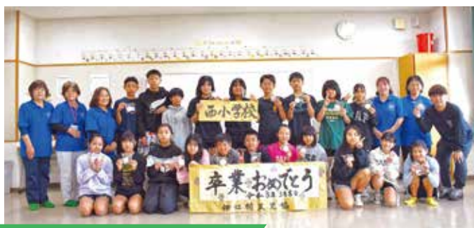
西小学校卒業生:3月9日(月)