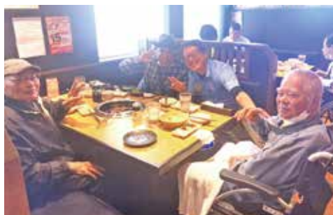
みんなで食べる焼肉は最高に美味しい♪