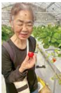
もぎたてイチゴの味は格別!!

今回の村外レクを計画・実施するにあたり、多くの皆様に温かなご理解とご配慮を頂き、楽しいひと時を過ごすことができました。たとえ障がいを抱え、自身の努力だけでは難しいことがあっても、多くの「みんな」で力を合わせることで、可能性が大きく広がるのだと改めて感じるとともに、次年度も会員皆さんと一緒に福祉向上を目指して様々な活動に取り組んでいきたいと思いました。