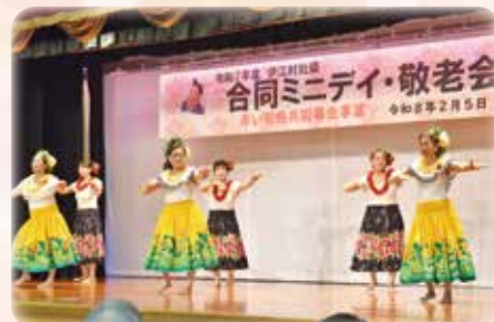
創作フラダンス (老人会の歌、ホロホロカー)