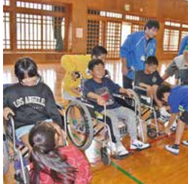
福祉体験学習:1月27日(火)