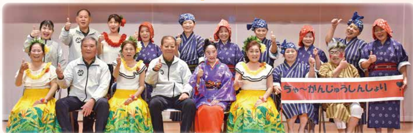
次回も楽しい合同ミニデイ・敬老会にしていきたいと思います！ご参加いただきありがとうございました！