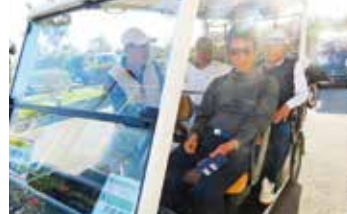
3位の東江前チーム