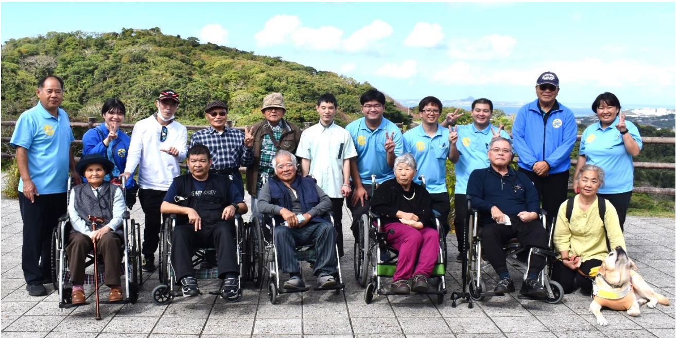
🌸八重岳にて伊江島を背景に記念写真 桜も笑顔も満開でした🌸

また、今回初めての視覚障がいのある会員を連れ立っての視察研修でした。水族館は「目で楽しむ」内容が多いため、これらをどのような言葉や表現を使うことで伝わるか、音声案内など活用できるものはないかなど職員それぞれが多くのことを考えるよい機会にもなりました。