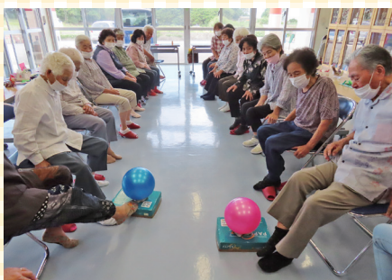
足を使ったボールリレーに熱中する皆さん(東江上区)

ミニデイへの参加をご希望の方は伊江村社会福祉協議会までお問合せ下さい。TEL.49-5104