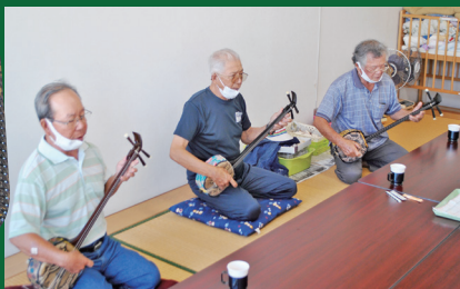
三線サークル活動の様子