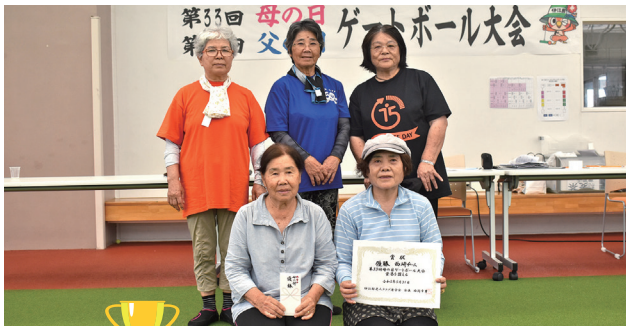
母の部優勝 西崎チーム