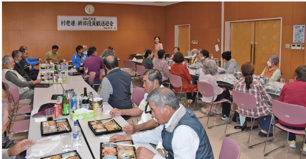
おいしい食事とお酒も準備して 終始和やかな歓送迎会となりました♪

4月11日に新旧役員歓送迎会が伊江村福祉センター、19日には村老連総会が改善センターホールにて開催されました。昨年に引き続き各世代との交流や健康づくり等精力的に活動していきます!