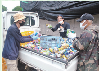
空き缶の回収・選別作業