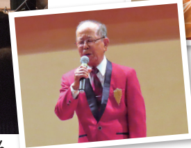
フィナーレでは「ふるさと」を会場一体となって合唱、舞台はうるま歌謡友の会の皆さん