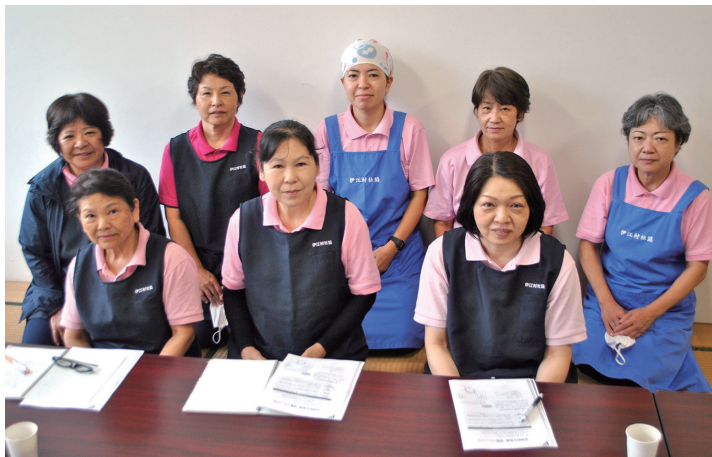
自宅での生活のお手伝いをさせていただきます。