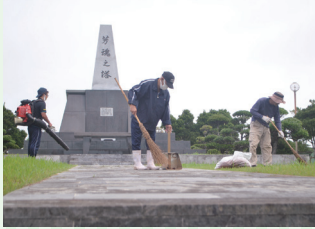
観光地の清掃活動

ぴゅあいいじま共同作業所では、観光地の清掃活動、空き缶の回収・選別作業、花卉出荷用新聞作り(古新聞)、農産物の管理・販売を行っています。