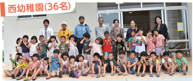
事故にあわないように気を付けます!

村老連女性部の皆さんが園児一人一人の交通安全への気持ちを込めて色とりどりのビーズを使用し手作りしました。普段からかばん等につけて、時にはこのお守りを見て交通安全についてのお話を思い出してくださいね(^^)