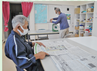
花卉出荷用新聞作り