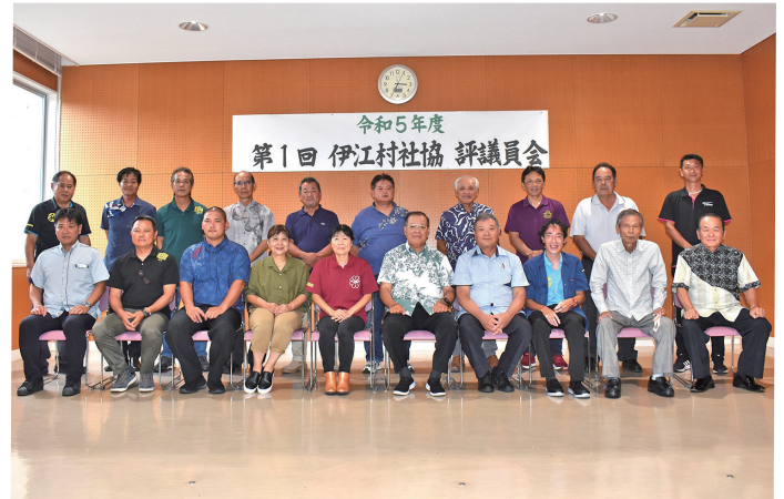
評議員会の皆さん

任期満了に伴い新たに理事8名(再任5名・新任3名)と監事2名(再任1名・新任1名)の就任が決められました。又、人事異動や新たな団体長就任等により今回5名の方が新評議員に就任されました。