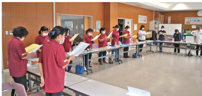
総会、民生委員の歌『花咲く郷土』♪