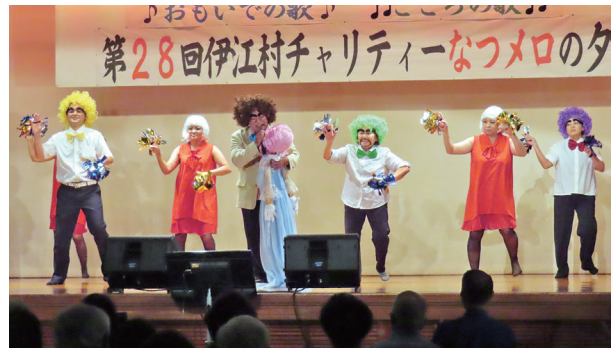
歌(お嫁サンバ)とダンスで 会場を盛り上げるふさと苑の皆さん