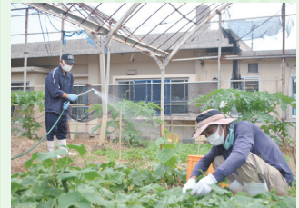
農産物の管理・販売