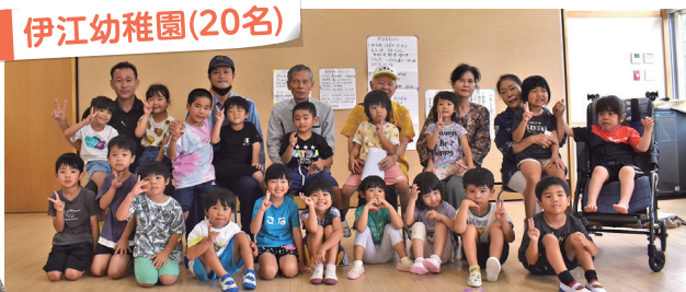
交通ルールをしっかり守ります!