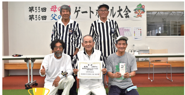
父の部優勝 川平Aチーム