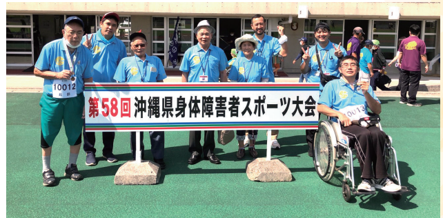
会場横幕前にて 入賞おめでとうございます！