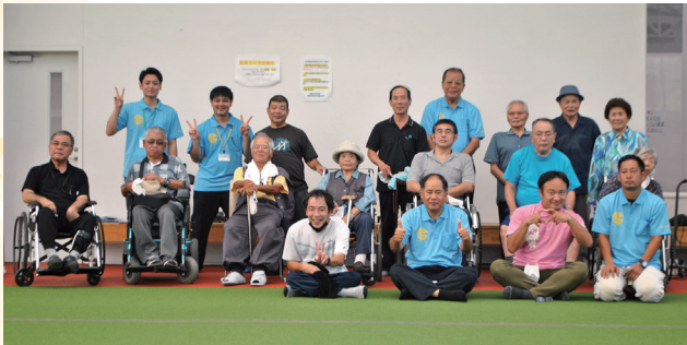
結団式 応援を力に変えて頑張ります！