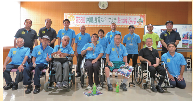
社協にておつかれさん会 来年目指せ優勝☆