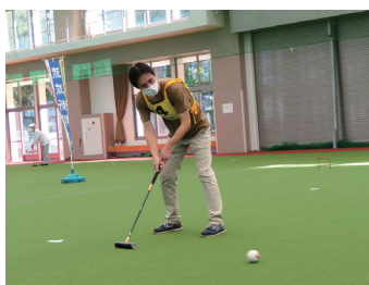
琉球新報北部支社長も プレイしました!